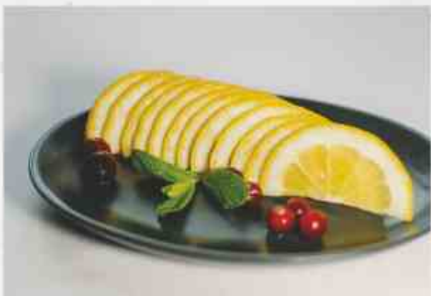
Лимон с клюквой