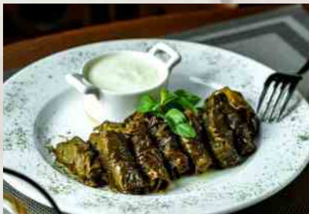
Долма с мацони из свинины и говядины