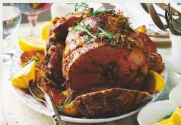
Рулет из телятины, фаршированный овощами