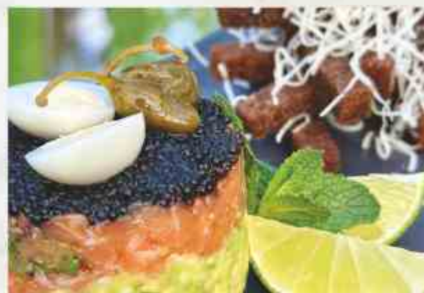
Тар-тар из лосося и авокадо