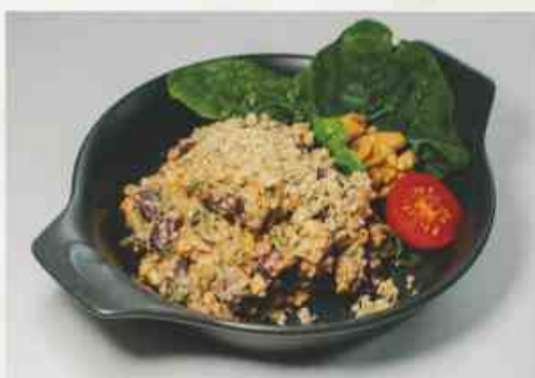
Лобио по-грузински фасоль, грецкий орех, лук, кинза, гранат