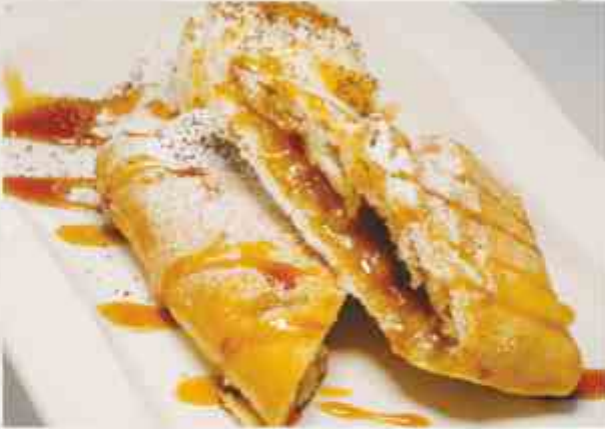
Штрудель яблочный/вишневый с ванильным мороженым