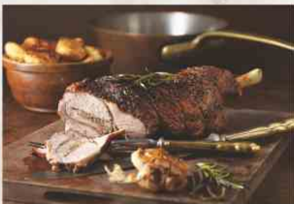
Бараний окорок, фаршированный киви