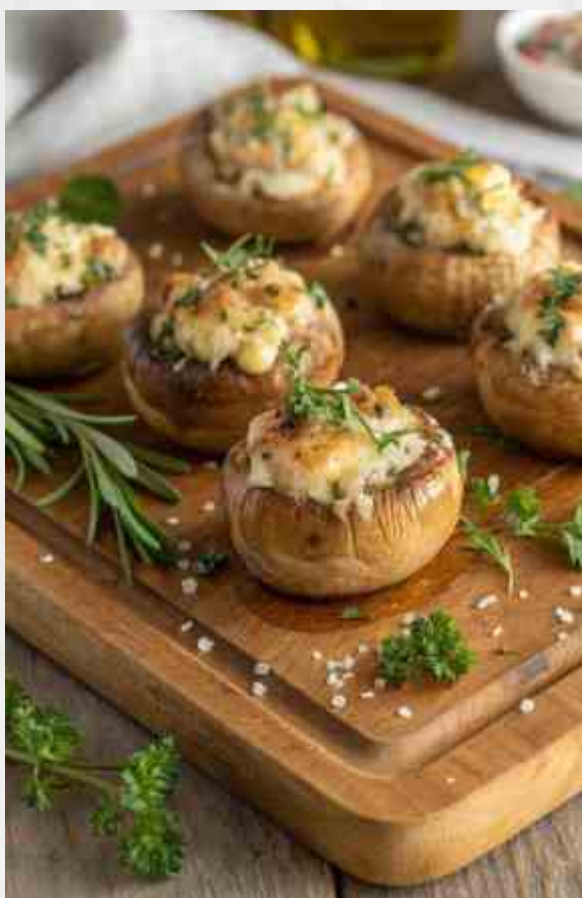
Грибы фаршированные шампиньоны, куриная печень, лук, болгарский перец, красное вино