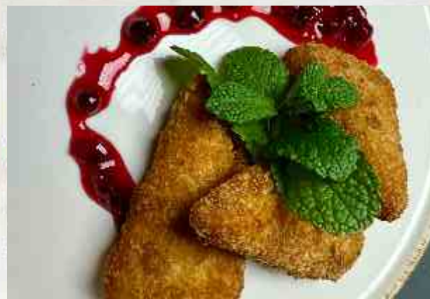
Сулугуни жареный с клюквенным соусом