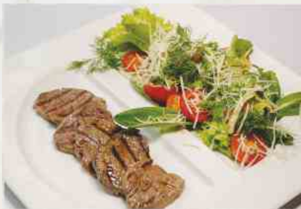
Теплый салат с телятиной телятина, микс салата, томат, соус бальзамик