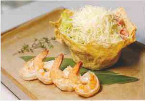
«Цезарь» с тигровыми креветками тигровые креветки, микс салата, помидор, сыр «Пармезан», соус цезарь, сухарики 300 г 1150₽