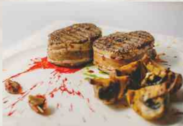
Медальоны в беконе говядина, бекон, грибы, сливки, сыр дор-блю