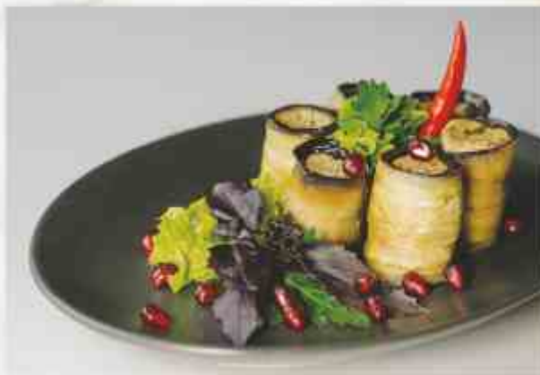
Рулеты из баклажан по-грузински баклажан, грецкий орех, лук, специи, гранат, зелень