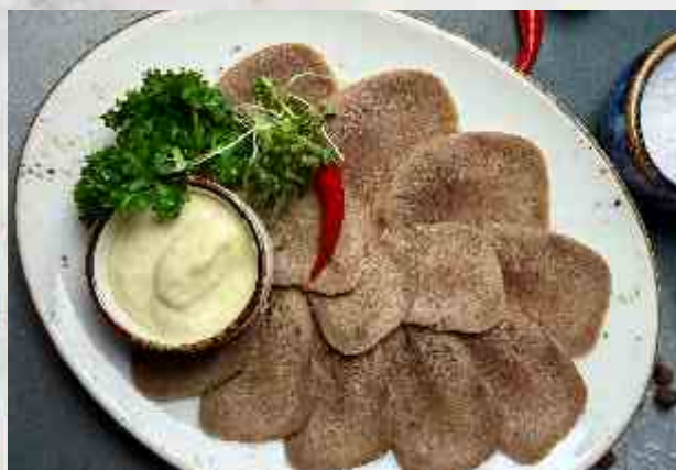
Язык отварной с хреном говяжий язык, хрен, зелень