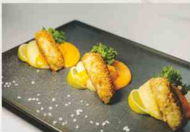
Биточки из судака с соусом из печеного перца филе судака, лук, сливки, картофельное пюре, перец