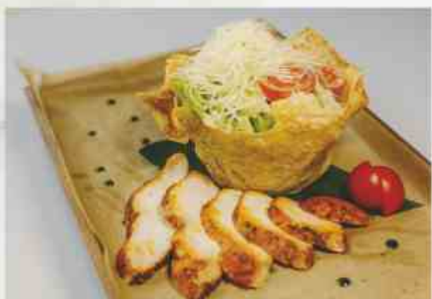
«Цезарь» с курицей куриное филе, микс салата, помидор, сыр Пармезан, соус цезарь, сухарики