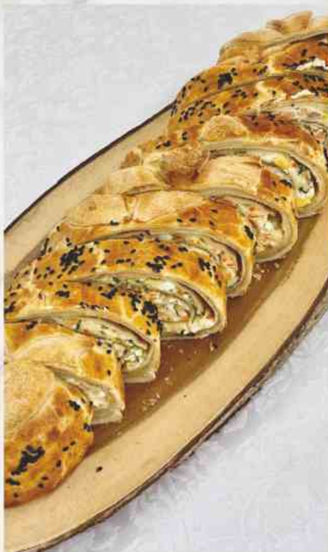
Пирог с лососем