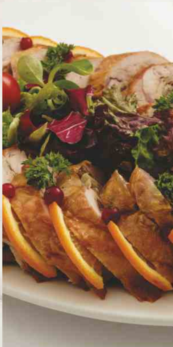
Курица фаршированная блинами