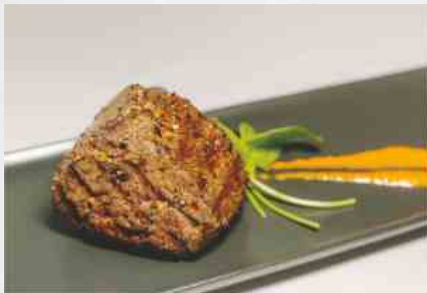
Говядина по-княжески говядина, грибы, сыр, чернослив, майонез, специи