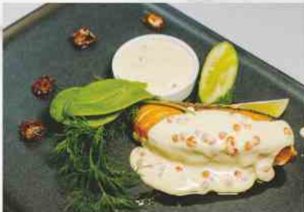
Семга под сливочным соусом семга, сыр, сливки, лимон, икра красная