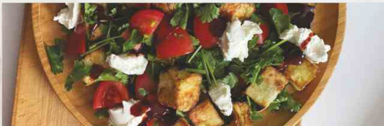
Салат с хрустящими баклажанами и мягким сыром