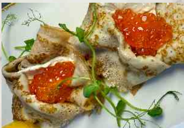
Блинчики с красной икрой блины, сливочный крем, икра красная