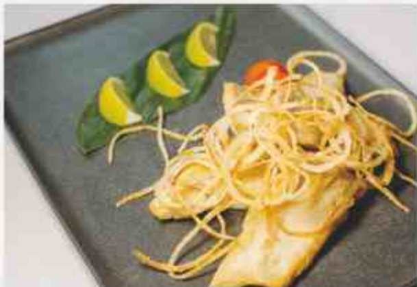
Судак жареный филе судака, лук