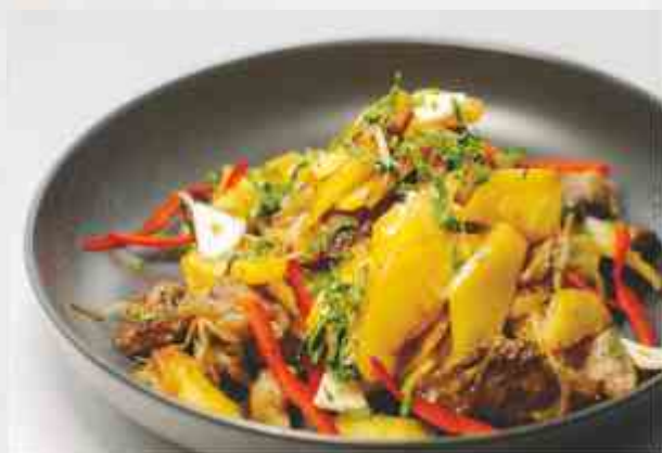
Картофель с пузаниной