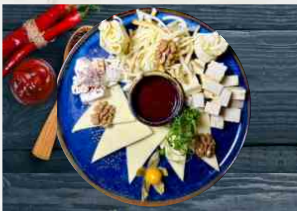
Ассорти домашних сыров сулугуни, брынза, сыр «Хинкали», чечил, ткемали