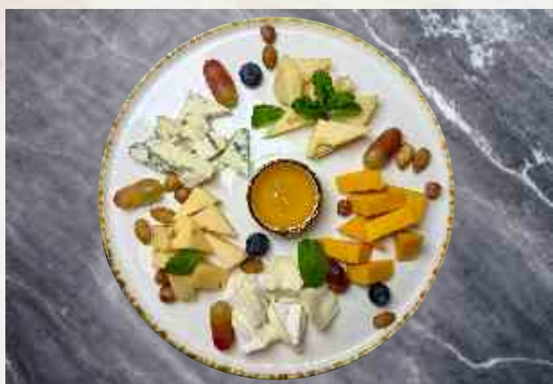
Собрание европейских сыров Чеддер, Бри, дор блю, ореховый сыр, маасдам, орехи, мед