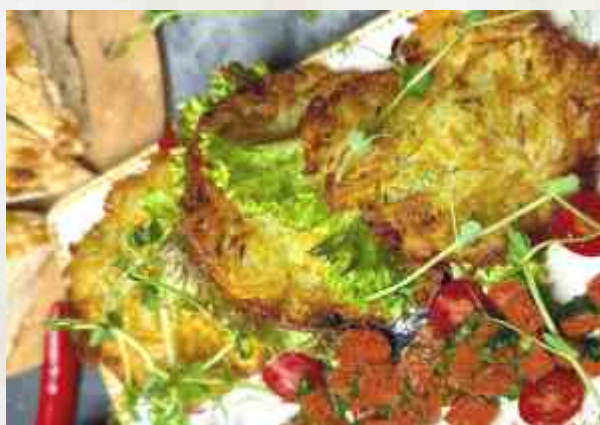
Драники по-царски с семгой