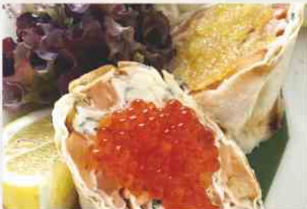
Рулетики из домашнего лаваша, рыбки и щучьей икры