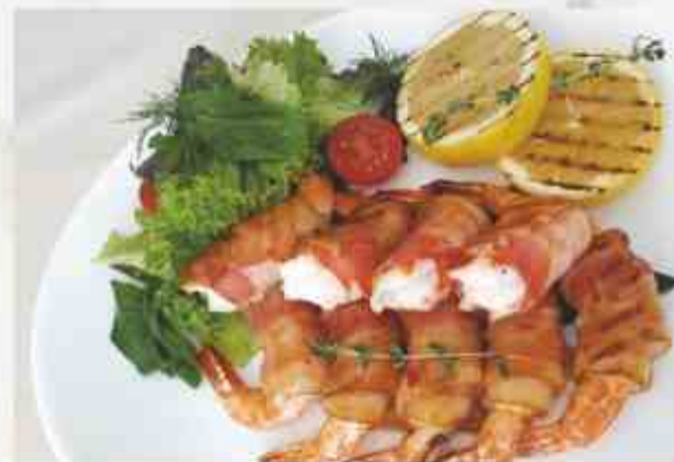
Тигровые креветки в беконе