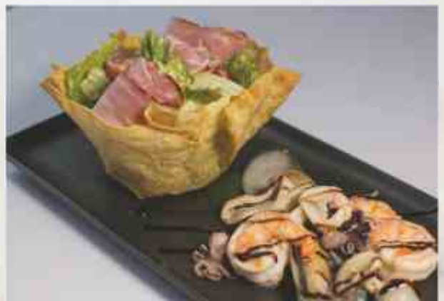
Теплый салат с морепродуктами гребешок, креветки, мидии, кальмар, микс салата, оливковое масло, томат 250 г 1550₽