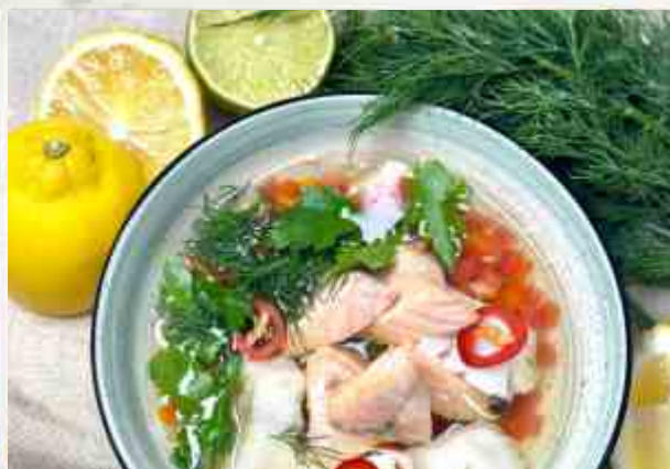
Уха с расстегаем семга, судак, помидор, лук, морковь, бол- гарский перец