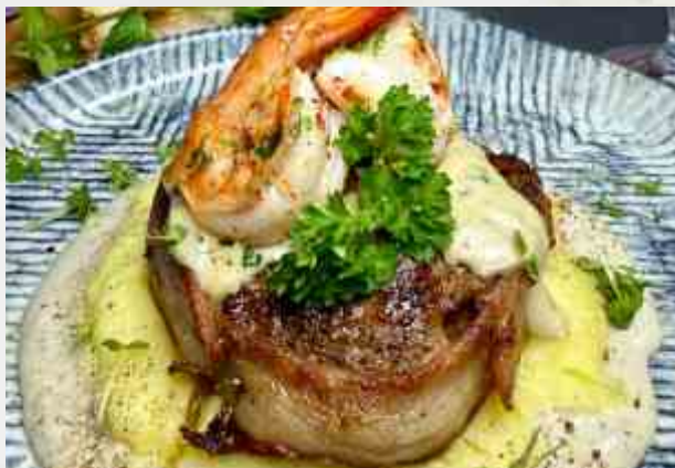
Стейк-бекон с креветками и грибным кремом