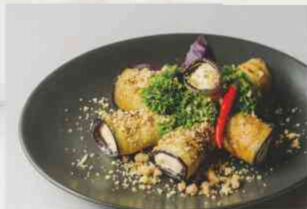
Баклажаны с творожным муссом жареные баклажаны на гриле в пряном масле, творожная масса, чеснок, специи