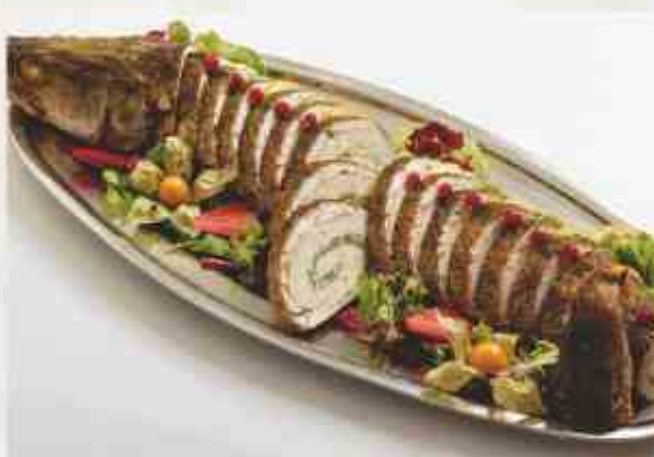
Судак, фаршированный красной рыбой