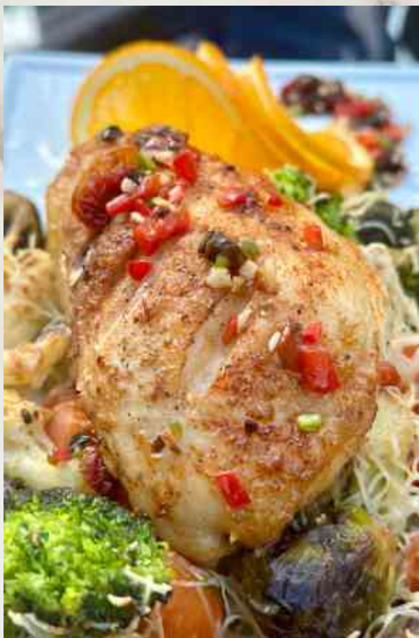
Печенный цыпленок с овощами бейби