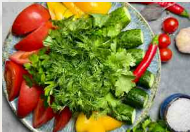
Ассорти из свежих овощей помидор, огурец, болгарский перец, редис, зелень, острый перец