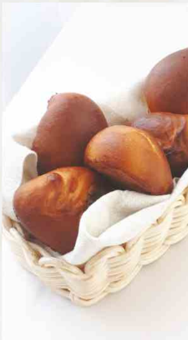
Корзина домашних пирожков пирожок с капустой, с мясом, с грибами, с картофелем