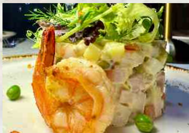
Оливье с креветкой креветка, картофель, морковь, зеленый горошек, красная икра, яйцо, огурцы маринованные, домашняя колбаса