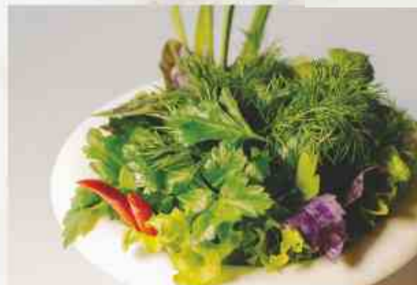
Букет ароматной зелени укроп, петрушка, кинза, лук зеленый, острый перец