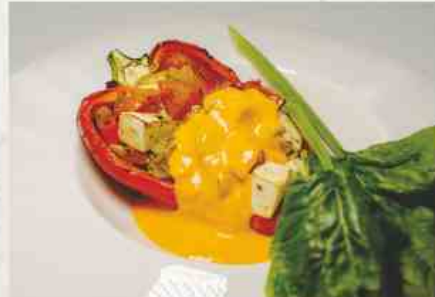
Сладкий перец, фаршированный томатом и мягким сыром