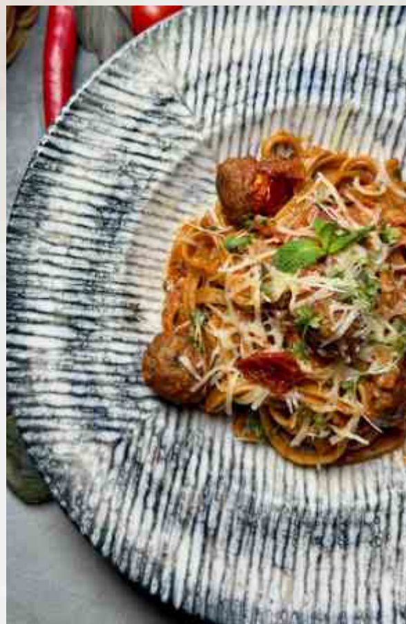
Аришта по-Еревански с шариками из ягненка