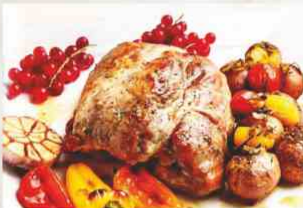
Свиной окорок, фаршированный виноградом и печеным луком