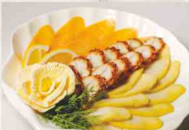
Коллекция рыбных деликатесов семга, угорь речной, балык масляной рыбы, масло сливочное, зелень