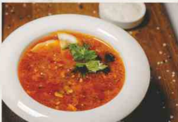
Солянка сборная мясная говядина, карбонат, колбаса с/к, филе ку- риное, лук, корнишоны, маслины, сметана