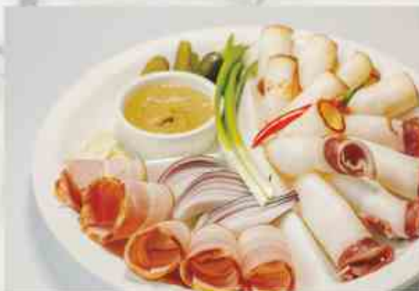
Закусочка под водочку шпик, сало, грудинка, огурец маринованный, лук, чеснок, горчица