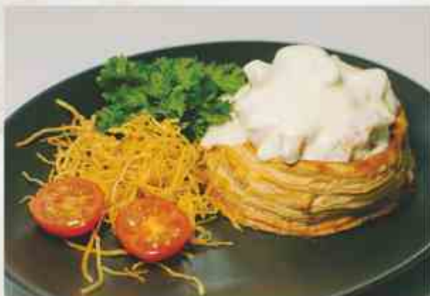
Консоме из морепродуктов креветки, мидии, кальмары, гребешок, сливки, сыр