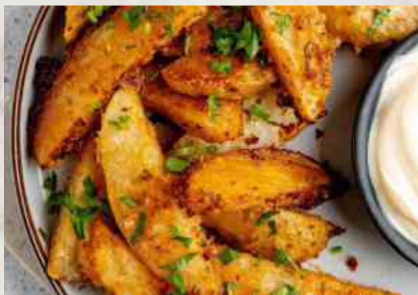
Картофель запеченный с разнотравьем