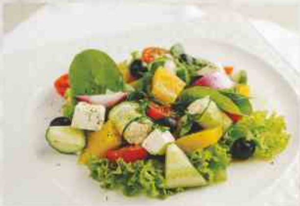
«Греческий» с оригинальной заправкой огурец, помидор, болгарский перец, микс салата, сыр фетаки, лук красный, маслины