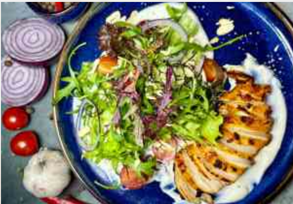
Теплый салат с куриной грудкой печеная куриная грудка, микс салатов, фасоль, помидор черри, красный лук, кешью, йогуртовая заправка 300 г 850₽