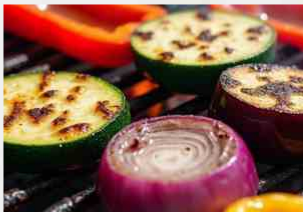
Овощи на гриле

баклажан, цукини, перец болгарский, лук, грибы, помидор