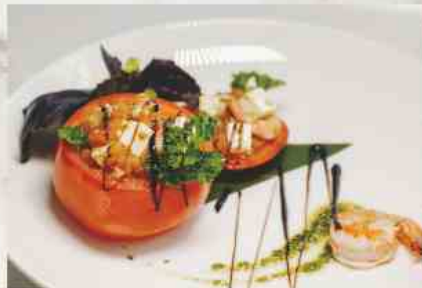
Томаты, фаршированные тигровой креветкой помидор, креветка тигровая, сыр «Фетаки», чеснок