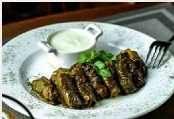
Долма с мацони виноградные листья, баранина, говядина, рис, сливочное масло