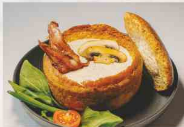
Грибной крем-суп (подаётся в горячей булочке) шампиньоны, белые грибы, сливки, лук, бекон