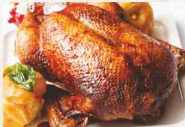
Утка медовая с яблоками