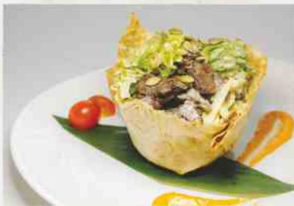
Теплый салат с куриной печенью

куриная печень, зеленое яблоко, тыквенные семечки, микс салата, томат