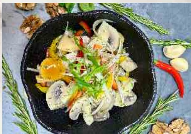
Грибы маринованные опята, маслята, грузди, лук, душистое масло, зелень