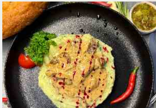
Строганов из сердца с картофельным парфе