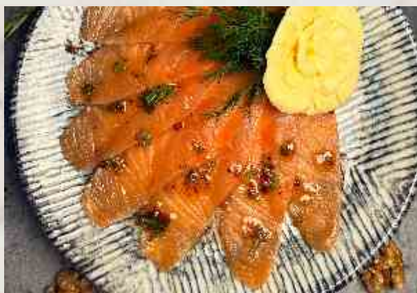
Семга слабосоленая филе семги, масло сливочное