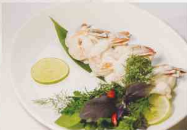
Тигровые креветки в сливочном соусе