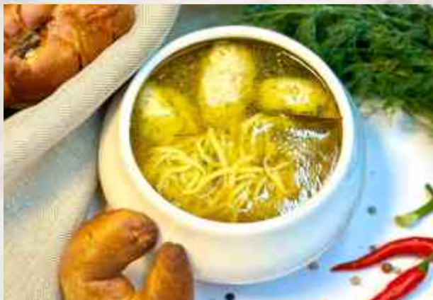
Суп-лапша с куриными кнелями куриный бульон, лапша домашняя, филе куриное, морковь