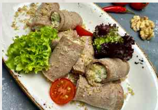
Рулеты из языка телянка с мягким сыром язык отварной, творожный сыр с зеленью