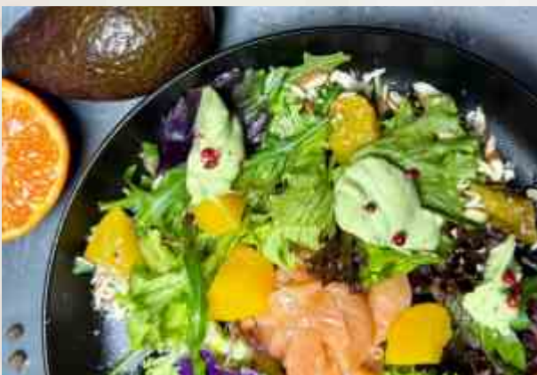
Салат с лососем и муссом из авокадо лосось, персик, микс салатов, миндаль, мусс из авокадо и цитрусовых 260 г 1350₽