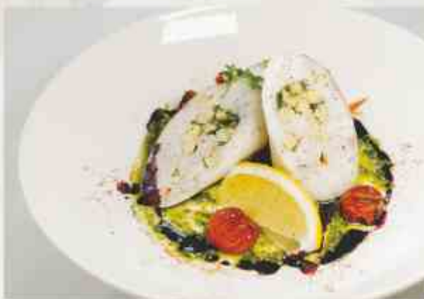
Судак, фаршированный тигровыми креветками и зеленым яблоком филе судака, тигровые креветки, яблоко зеленое