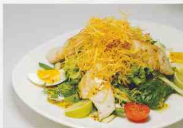
Салат из судака судак, огурец свежий, стручковая фасоль, яйцо, картофель пай