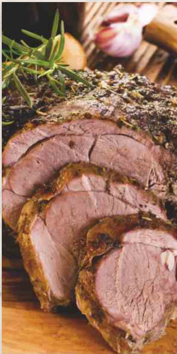
Телятина под сачи