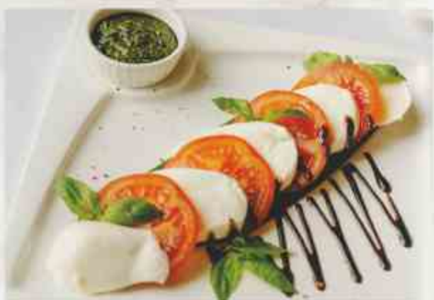
«Капрезе» помидор, сыр Моцарелла, соус песто