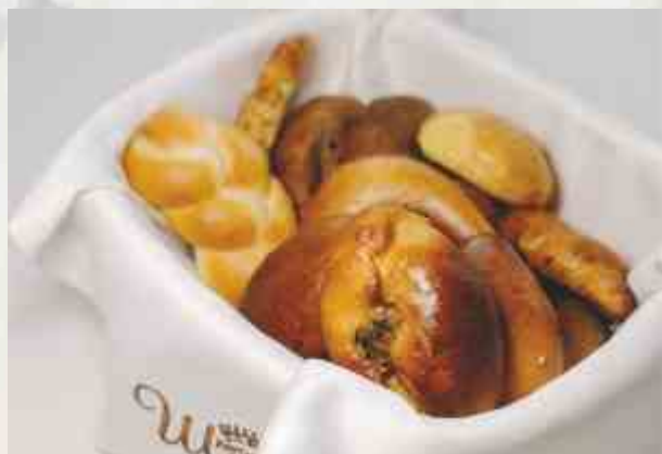
Хлебная домашняя корзина хлеб пшеничный, отрубной, ржаной, морковный, сырный, чесночный, луковый, пирожок с капустой, с мясом, с грибами, с картофелем