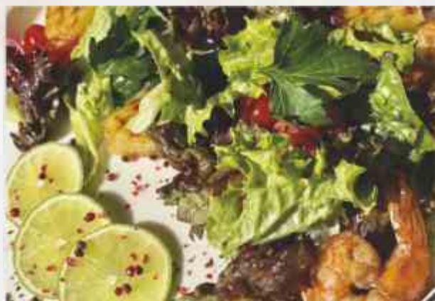
Салат с креветкой и жареными ананасами