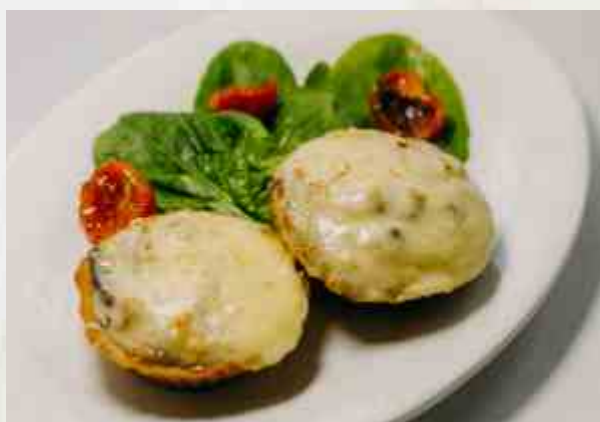
Грибной рататуй в тартини

шампиньоны, белый гриб, сливки, сыр, тартини