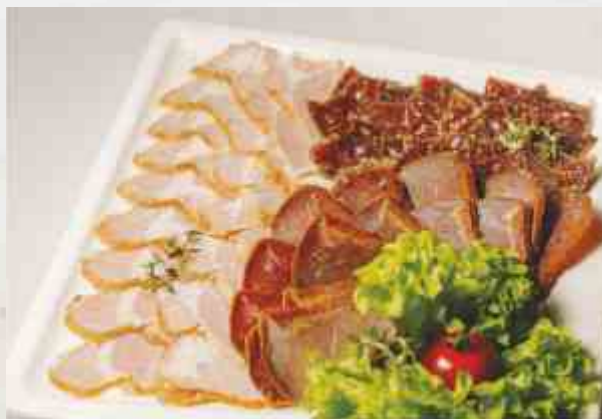
Кавказские деликатесы пастрома, бастурма, суджук