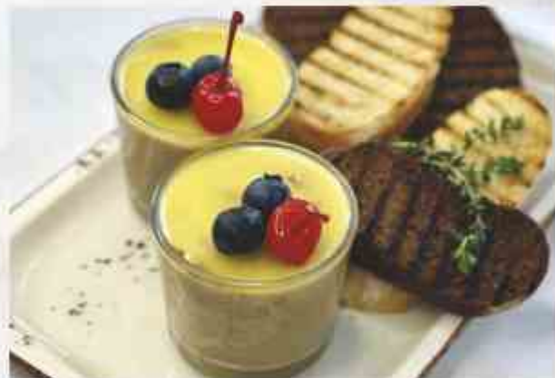
Паштет из куриной печени