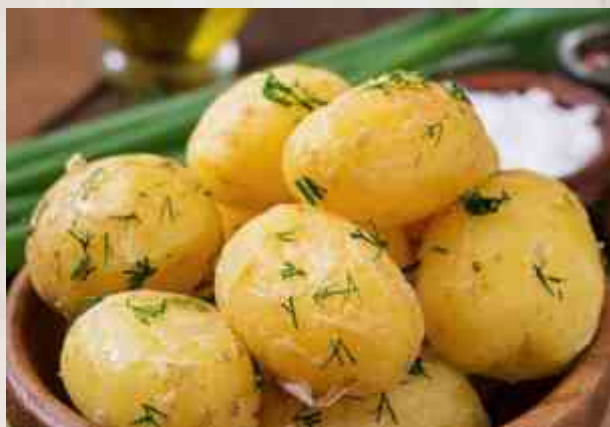
Картофель молодой отварной с пряным маслом