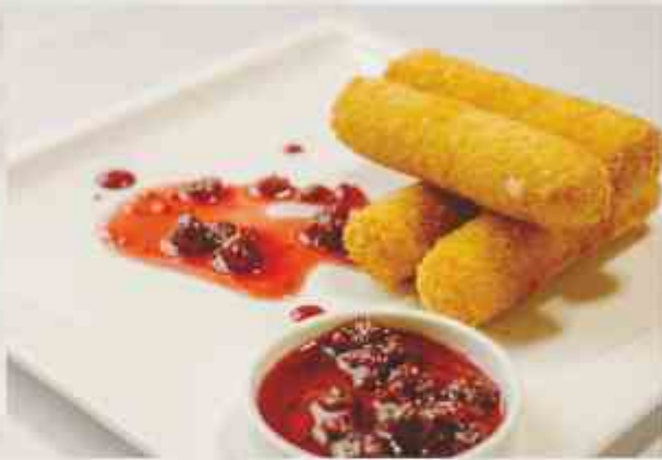
Фромаж из твердого сыра с малиновым соусом сыр, панировочные сухари