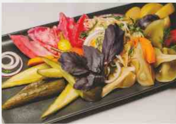
Соленья по-домашнему огурец соленый, помидор маринованный, острый перец, капуста квашеная, чеснок маринованный