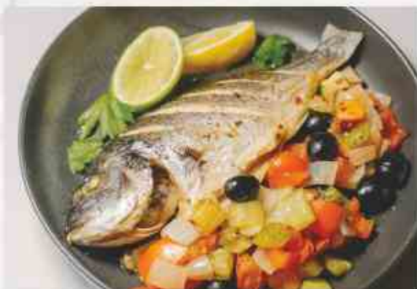
Дорадо с овощами дорадо, томаты, лук, цуккини, болгарский перец