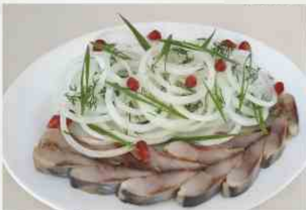
Сельдь с лучком филе слабосоленой сельди, маринованный лук, душистое масло