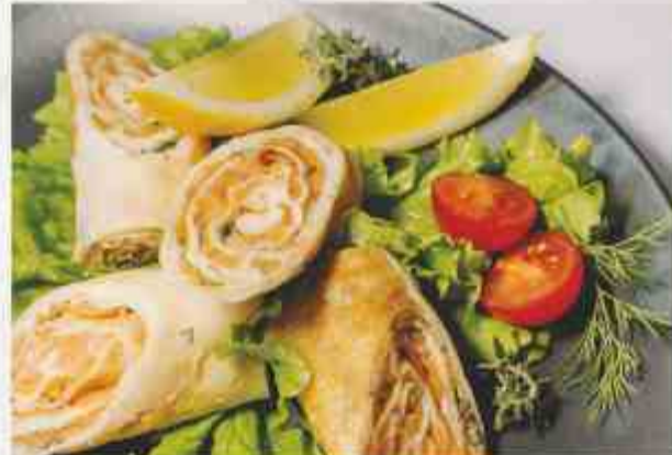
Блинчики с норвежской семгой балык семги, сыр сливочный, пряности