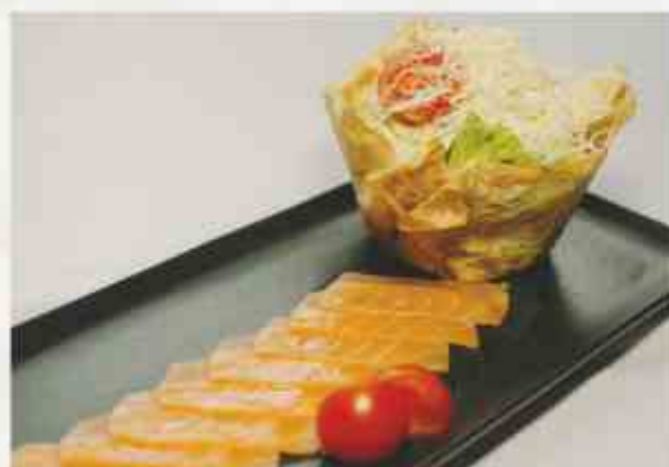
«Цезарь» со слабосоленой семгой семга слабосоленая, микс салата, поми- дор, сыр Пармезан, соус цезарь, сухарики