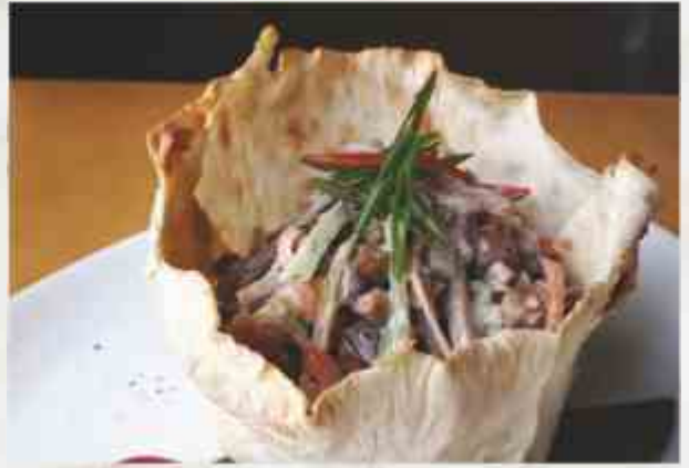
Салат из языка с болгарским перцем говяжий язык, помидор, перец болгарский, огурец свежий, огурец маринованный, грибы маринованные 240 г 830₽