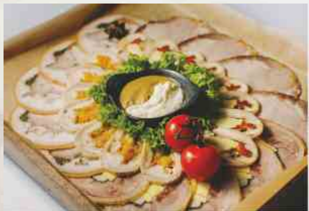
Коллекция мясных деликатесов по-домашнему буженина, рулет куриный, рулет из утиного мяса, рулет из индейки, пузанина, хрен, горчица