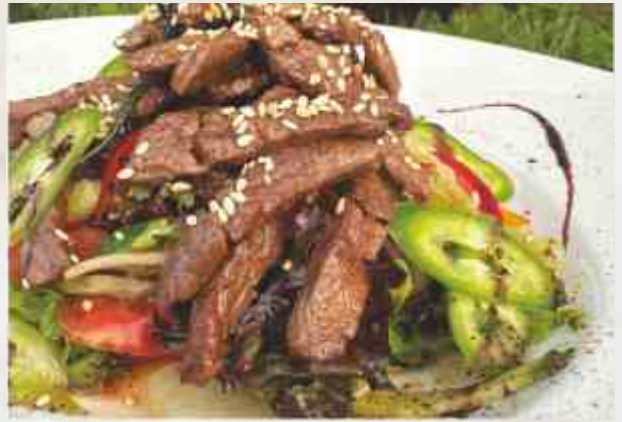
Салат пикантный с телятиной 210 г 1150₽